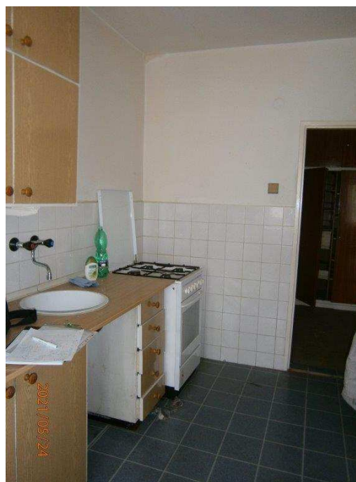
Kuchyň - vybavení