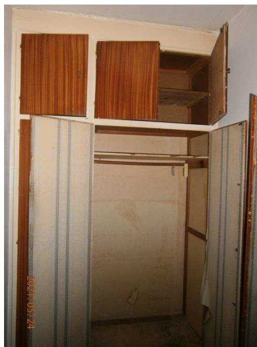
Chodba – vestavěná skříň