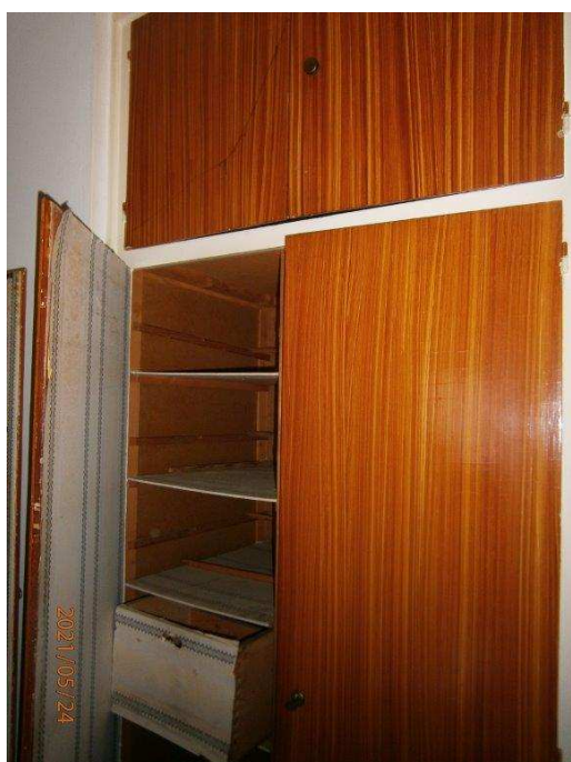
Chodba – vestavěná skříň